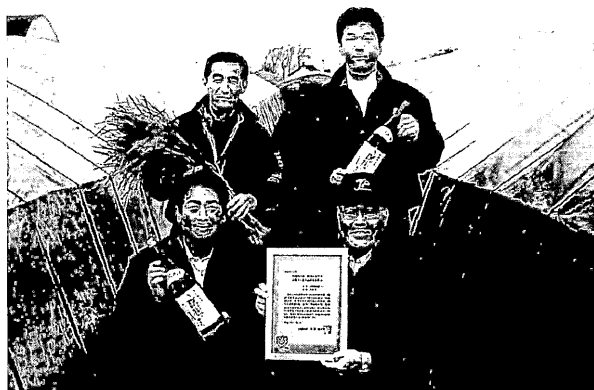
写真1 酒米栽培グループ「すいせい」メンバー

この新しい農業生産方式は、土作りに良質な堆肥を多く導入したり、低化学肥料、低農薬の実現によって、より安心・安全な農産物の生産を目指す環境保全型農業生産方式である。